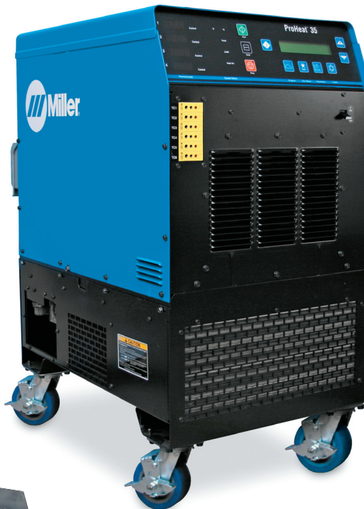
Источник питания ProHeat 35 (907690), показан с индукционным охладителем большой мощности (301298) и дополнительным шасси (195436).

Индукционные нагревательные кабели с жидкостным охлаждением ProHeat созданы, чтобы гарантировать гибкость, поэтому они могут быть скручены витками разных форм и размеров, приспособивая к любым нуждам индукционного нагрева. Идеально подходит в таких случаях, когда геометрические данные и температура не позволяют использовать охлаждаемые воздухом одеяла.