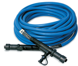
Показан кабель индукционного нагрева с жидкостным охлаждением ProHeat.

При сварке создается более хорошая рабочая среда . Исключается опасность для сварщика от открытого огня, взрывчатых газов и раскаленных элементов, которая связана с нагревом газовым топливом и сопротивлением.