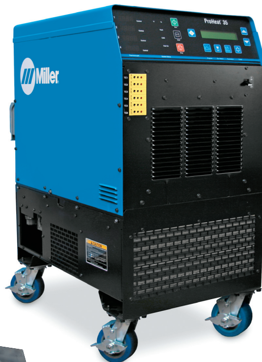
Afgebeeld de ProHeat 35 stroombron (907690) met zware inductiekoeler (301298) en wielonderstel (195436 optie).